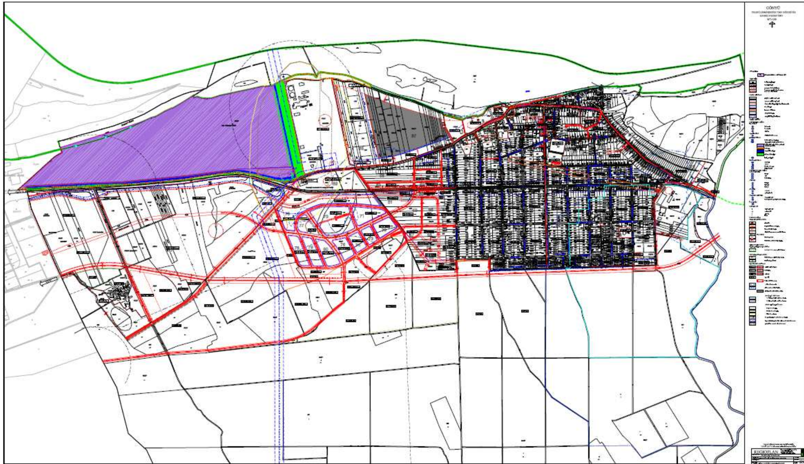
Hatályos szabályozási terv a beépítésre szánt területre